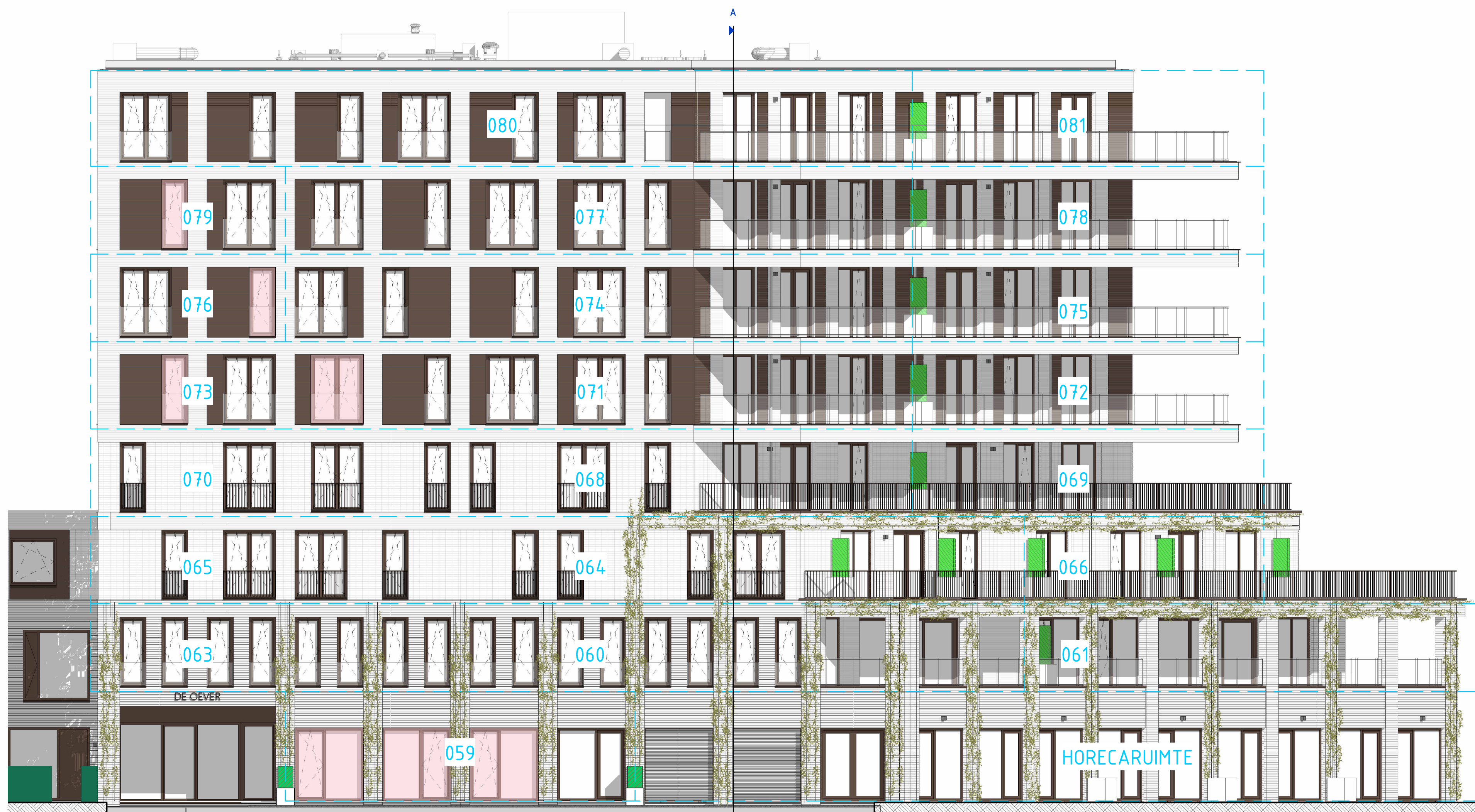
VOORGEVEL / HOFZIJDE (NOORD-WEST)