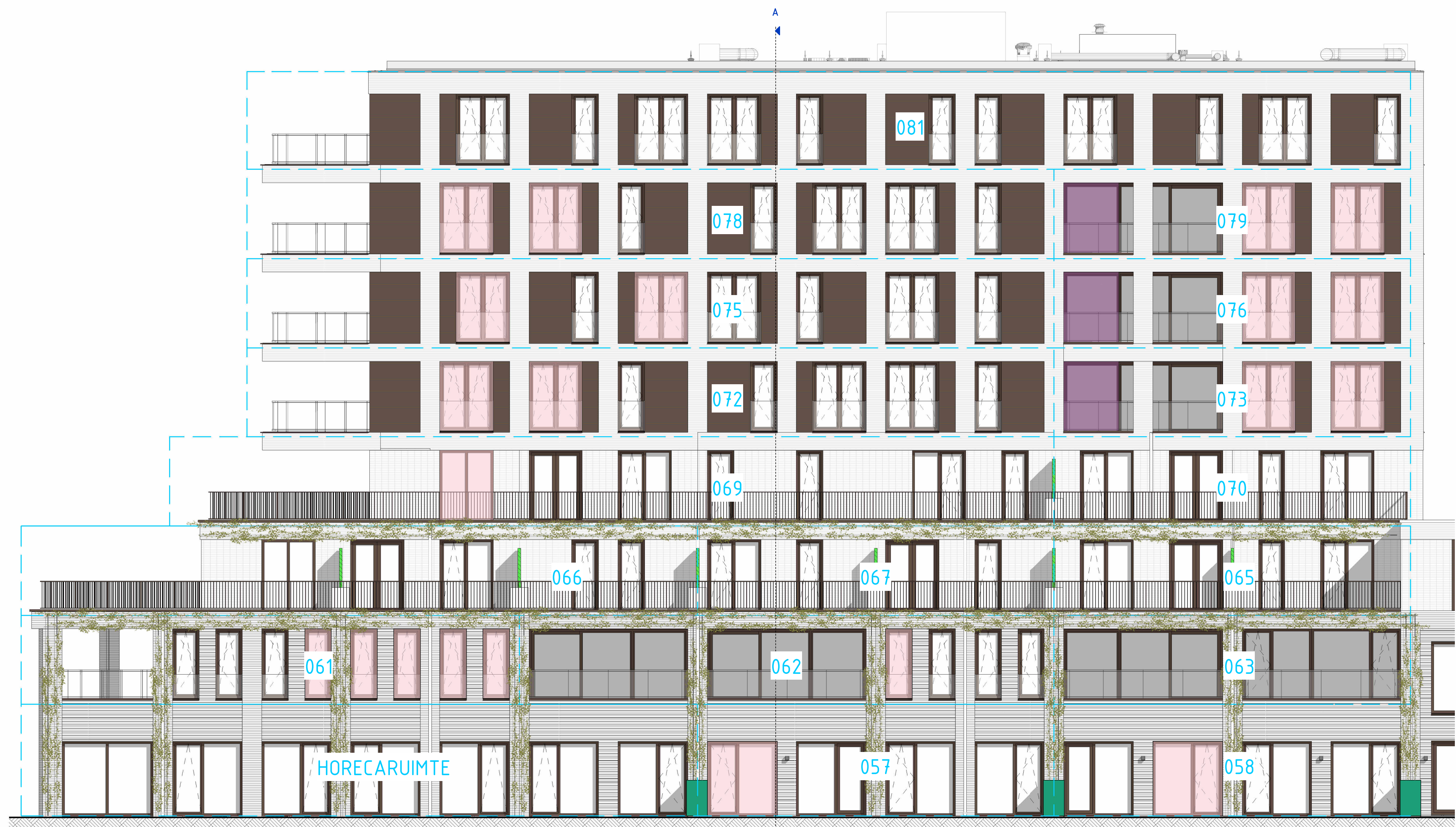
ACHTERGEVEL / BUITENZIJDE (ZUID-OOST)