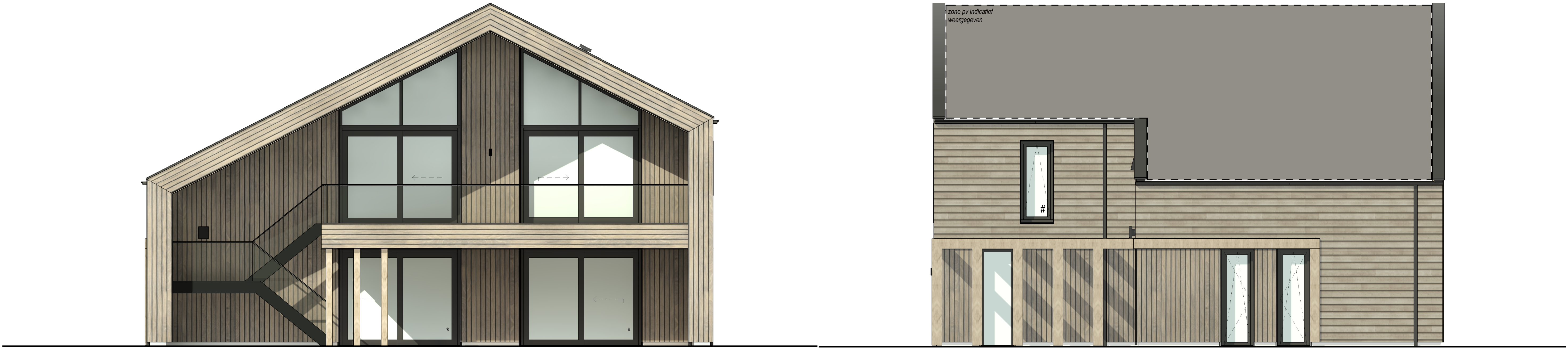
Achtergevel - optie buitentrap